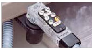
Post-Mezcla 8 Botones (BAR730 Sistema Completo)