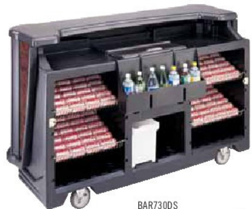
BAR730DS (Se muestra con cuatro rejillas de alambre, opcionales.)