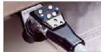
Premezcla 6 Botones (BAR730 Sistema Completo)