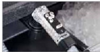
Post-Mezcla 5 Botones (BAR650 Sistema Completo)