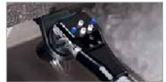
Premezcla 5 Botones (BAR650 Sistema Completo)