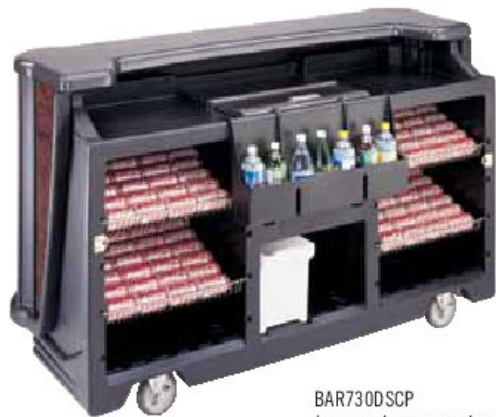
BAR730DSCP (se muestra con cuatro rejillas de alambre, opcionales.)