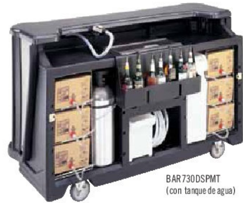
BAR730DSPMT (con tanque de agua)